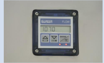
Vorwählzähler für Füllmenge

Leistung: 3 Liter bis 240 Beutel/Stunde 5 Liter bis 200 Beutel/Stunde 10 Liter bis 120 Beutel/Stunde